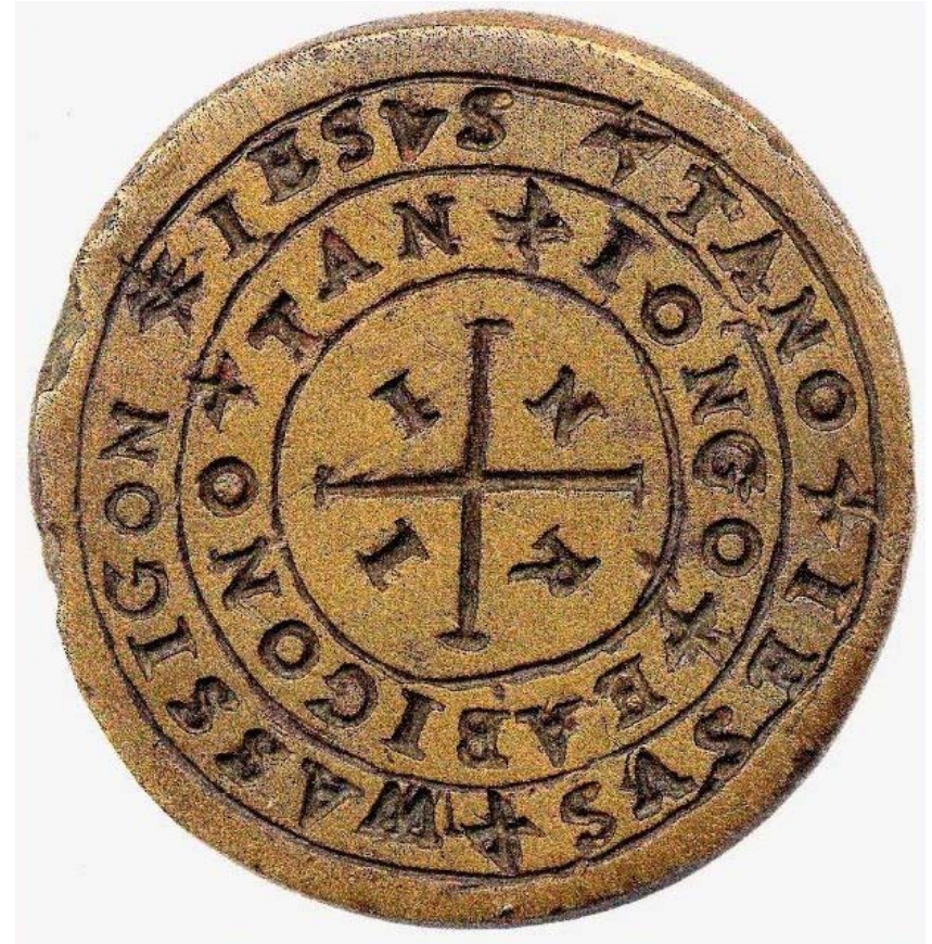
Platte des Petschafts aus Messing, in Kayna 1887 gefunden im Schutt der niedergebrannten und abgerissenen ehemaligen Brauerei. Es wurde an das Provinzialmuseum in Halle, Saale abgegeben und be-